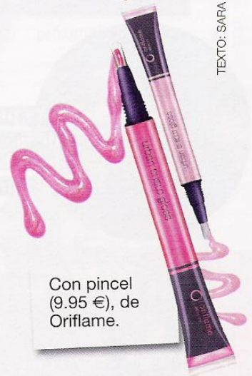
Con pincel (9.95 €), de Oriflame.

ROTULADOR: Lo bueno es que el color dura un montón porque penetra en los labios. Elígelos con bálsamo, si no se te pueden resecar.