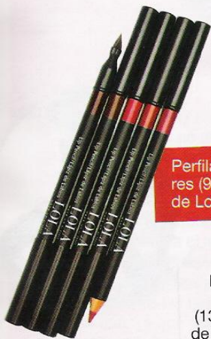
Perfiladores (9.90 €), de Lola.