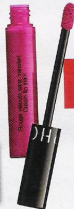
Rosa intenso (9,90 €), de Sephora.