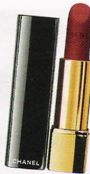
Burdeos (32 €), de Chanel.