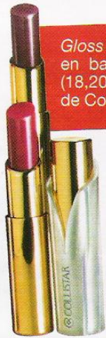
Gloss en barra (18,20 €), de Collistar.