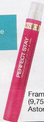
Frambuesa (9,75 €), de Astor.