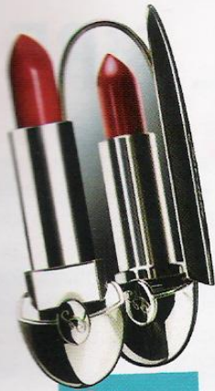
Con espejo (41 €), de Guerlain.