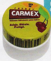
Bálsamo (2,95 €), de Carmex.